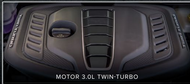
MOTOR 3.0L TWIN-TURBO