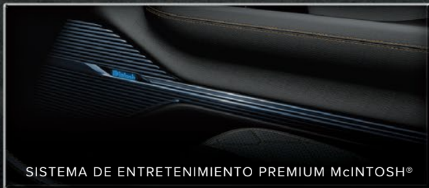
SISTEMA DE ENTRETENIMIENTO PREMIUM McIntOSH®