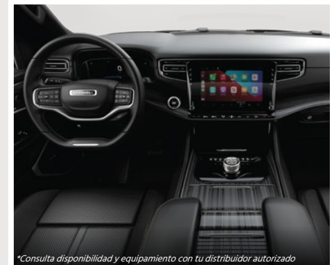
Asientos en piel Nappa color negro