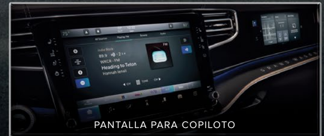
PANTALLA PARA COPILOTO