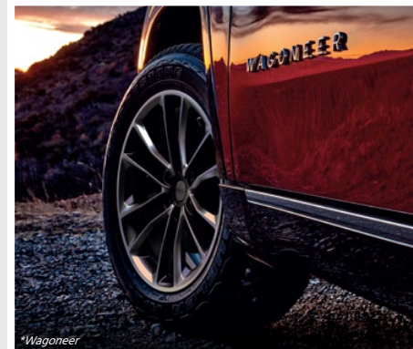
Rines de aluminio de 22"